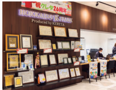
今回訪れた「北海道軽パーク北広島店」には、「リーダースアワード」の盾や表彰状も

けます。大学の奨学金を返している社員の話を聞き、「これは大きな社会課題だと思いました。しかも北海道は全国から見ても教育費にかける金額が少ないので、自分たちの仕事を通じてこれを解決したいと思うようになりました」と語ります。青年海外協力隊でマレーシアにいたとき、学んで知識をつけることは、生きる知恵や想像力を養うと実感。だからこそ、北海道の未来を支える子どもたちに十分な教育を受けてほしいと願っています。車を購入したファミリーと北大を見学するツアーも実施し、「実際に行く、将来通いたいって子どもも思うでしょ？」とニッコリ。