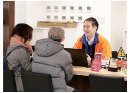
元気で丁寧な印象の店内。顧客に対してだけでなく、従業員同士のあいさつを徹底し、笑顔が心がけています

楽しい。だから北海道に軽自動車をもっと普及させたいのです。そして、少しでも安く購入し、長く乗ってもらおうことで、道民の皆さんのお財布に余裕ができれば」と話します。 さらに「もしお子さんがいるご家庭なら、余裕ができた分を教育資金に回してほしい」と続