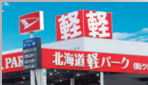
北海道軽パーク北広島店完成